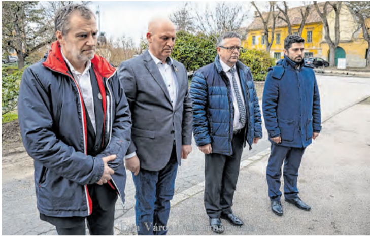
Folytatás az 1. oldalról

A városvezető hozzátette: - A mi feladatunk megakadályozni azt, hogy egy ilyen átkozott rendszer még egyszer eluralkodjon rajtunk. A ma élőknek ezért kell rendszeresen emlékezni és feleleveníteni a történelmünk ezen sötét időszakát, megismertetve a gyermekeinkkel is a régi családi történeteket.