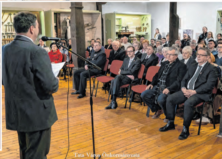
Tata Város Önkormányzata

volna a legsúlyosabb büntetést. Börtönből szabadulása után a kommunista gépezet a felnőtté válását és a felnőtt életét is megalázta. A dokumentumfilm délutáni vetítését követően az alkotóval Rigó Balázs beszélgetett. Tata alpolgármestere az esemény kapcsán úgy nyilatkozott: - Az emléknaphoz kötődően sokszor említjük a