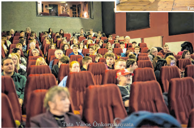
Tata Város Önkormányzata

A koszorúzást követően immár hagyományosan a témához kapcsolódó filmvetítésnek adott helyet az Est Mozi, ahol idén Varga Ágota: Megbélyegzetten című dokumentumfilmjét láthatták az érdeklődők két vetítés alkalmával. A magyar történelmi dokumentumfilm Kovács László élettörténetét mutatja be, aki 14 éves kamaszként lázadt fel 1968-ban a rendszer ellen, s barátaival levelet írt a Szabad Európa Rádióknak. Bár ez igazából gyerekcsíny volt, a belügyi szervek példát statuáltak. László apja a párhűség mintaképe, a bírósági tárgyaláson mintha egy idegenre kérte