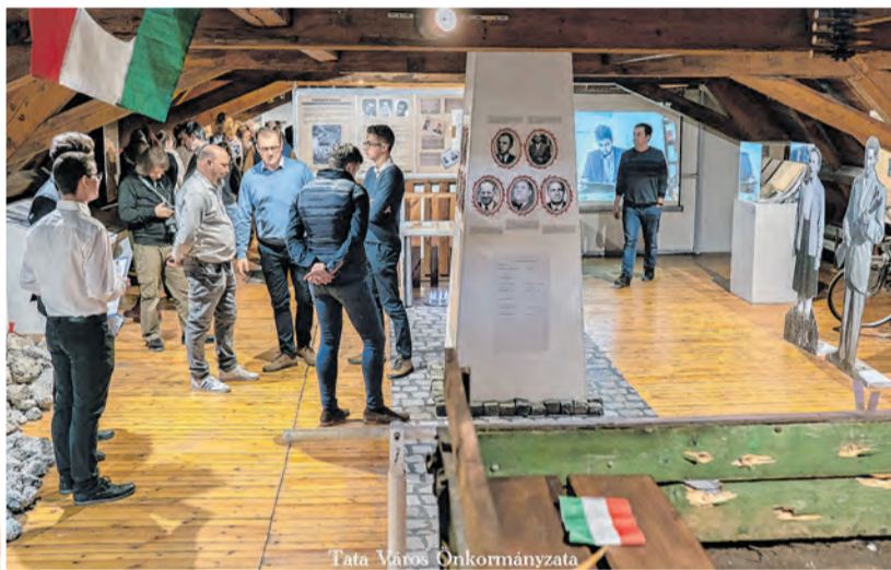
Tata Város Önkormányzata