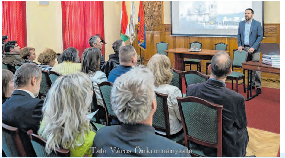
Tata Város Önkormányzata