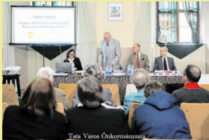
Tata Város Önkormányzata

A küldöttgyűlésen többek között elfogadták a 2023-as költségve-